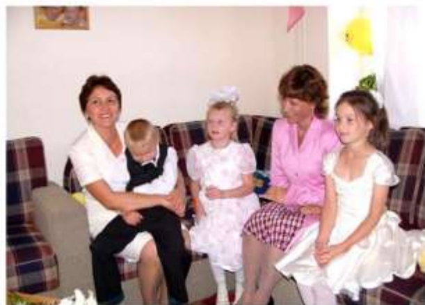
Принцесса Норвегии Марта-Луиза