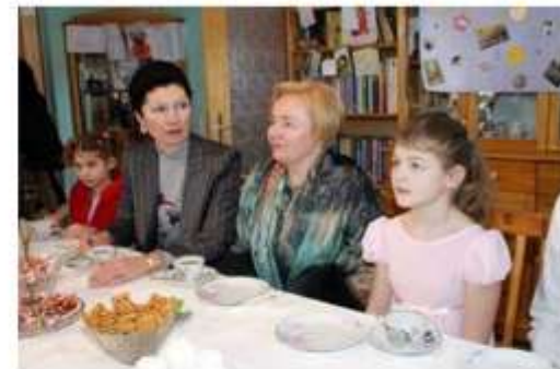
Л. Путина и г-жа Клестиль-Лёффлер в Томилино