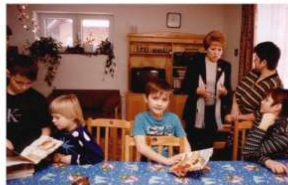
В. Матвиенко в Томилино