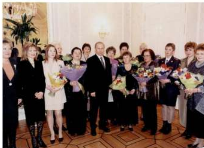
SOS-мама из Лаврово среди 12 Почетных женщин-педагогов России на встрече с президентом В. Путиным в Кремле.