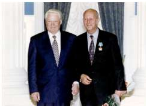
Президент SOS-Kinderdorf International Хельмут Кутин на церемонии награждения