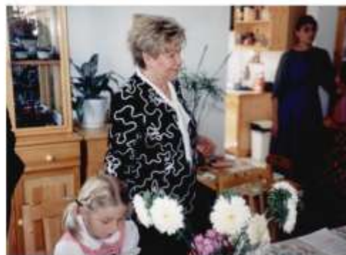
Н. Ельцина в Томилино