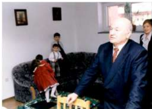
Мэр Москвы Ю. Лужков на церемонии открытия Детской деревни-SOS в Томилино